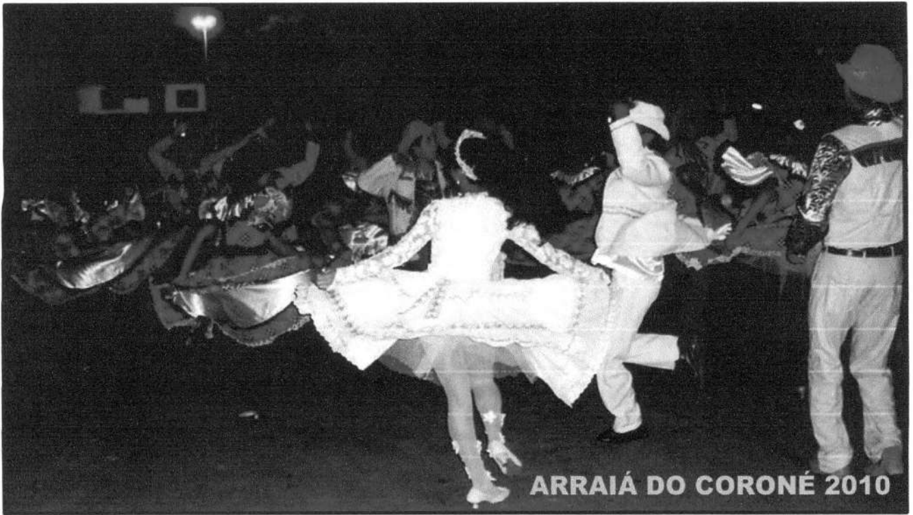
ARRAIÁ DO CORONÉ 2010