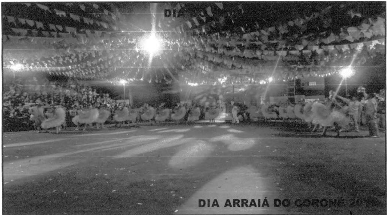
DIA ARRAIÁ DO CORONÉ 2019