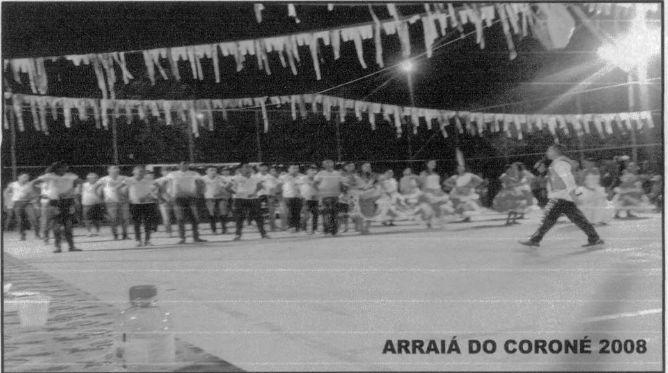
ARRAIÁ DO CORONÉ 2008