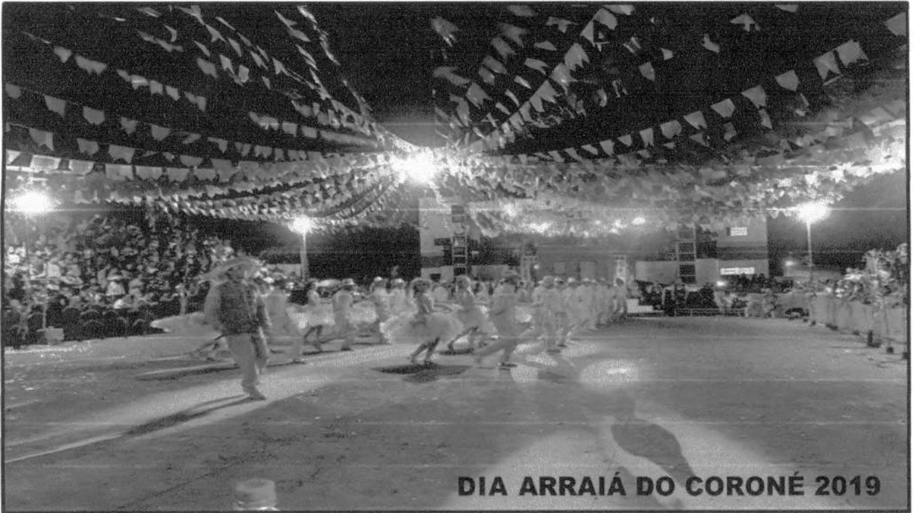
DIA ARRAIÁ DO CORONÉ 2019