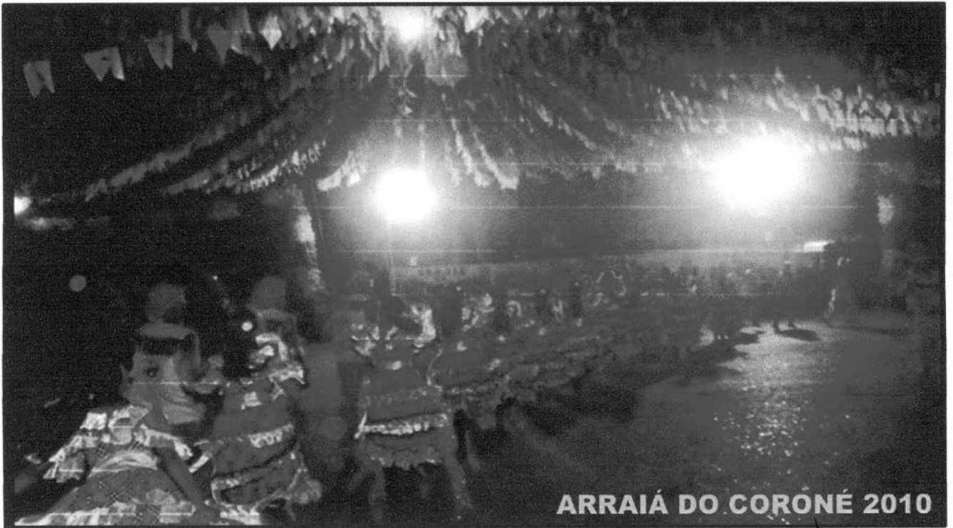
ARRAIÁ DO CORONÉ 2010