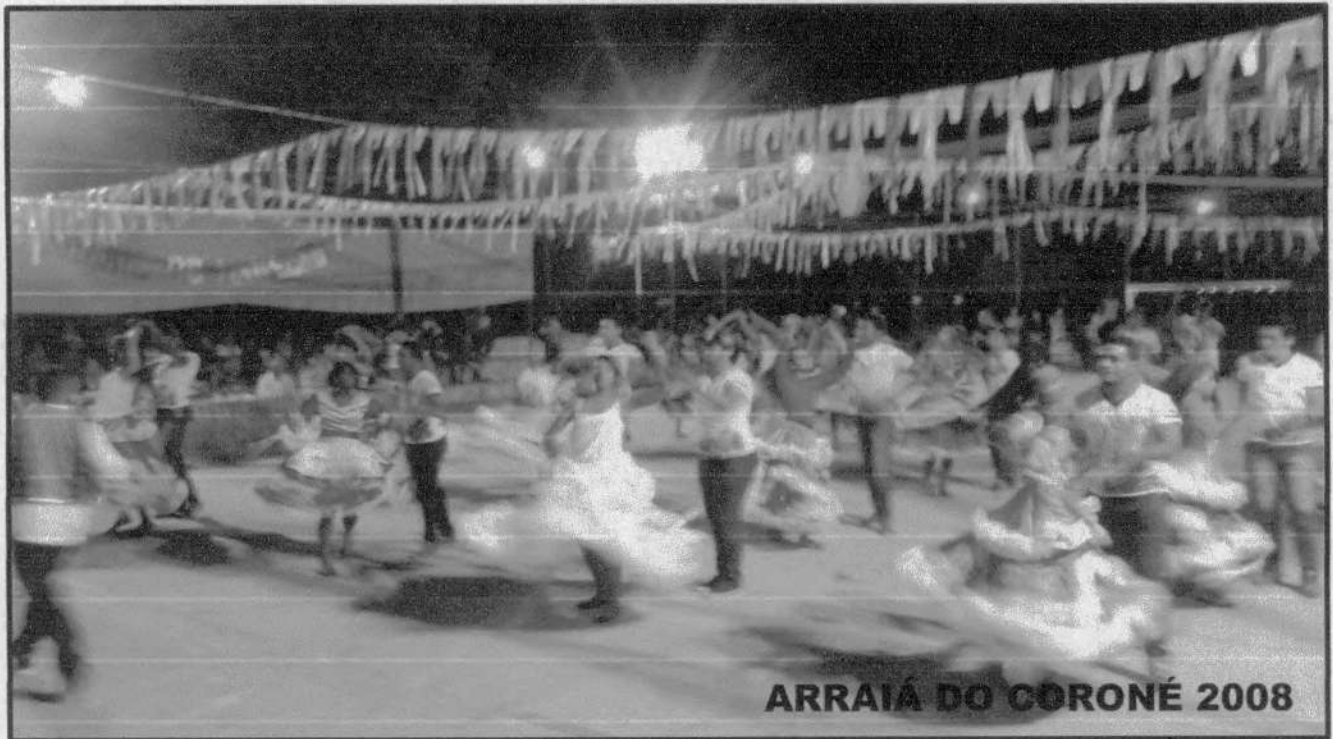
ARRAIÁ DO CORONÉ 2008